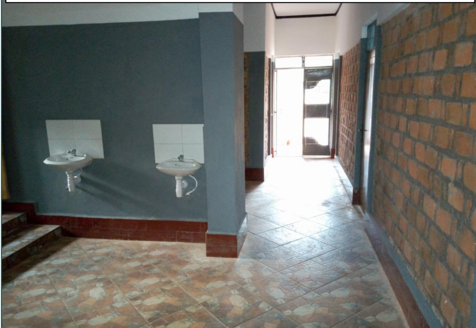
Korridoren set mod hovedindgangen med vaskene foran toiletterne.