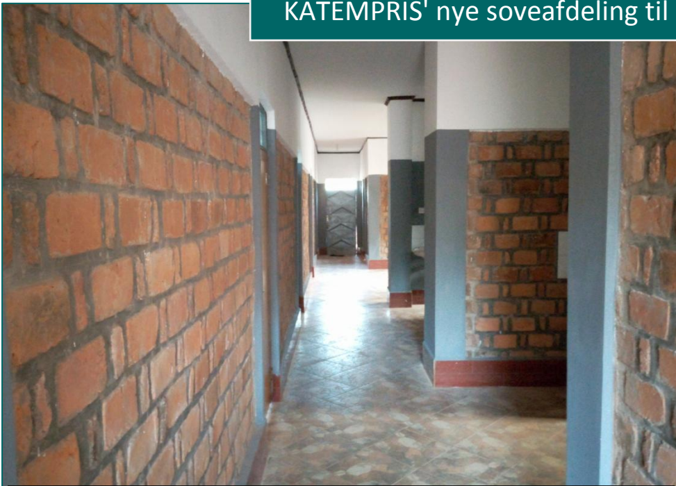
Korridoren set fra hovedindgangen – med indgange til værelser og bade- og toiletfaciliteter samt fællesrummet for enden.