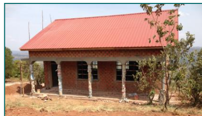
5. Det nye klasseværelse er næsten færdigt.