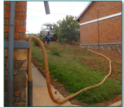
1. Fra en tankvogn bliver der leveret 15,000 liter vand til skolen.