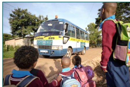
6. Den nye skolebus