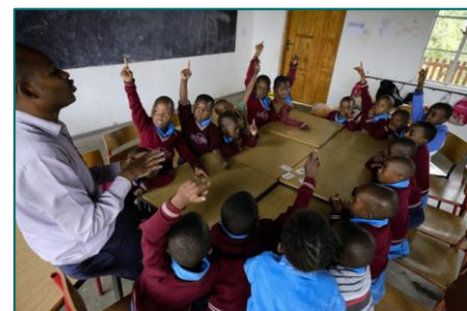
9. Matematikundervisning i 1. klasse