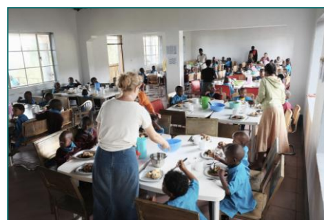
8. De nye klasseværelser fra januar 2016 som dining hall.