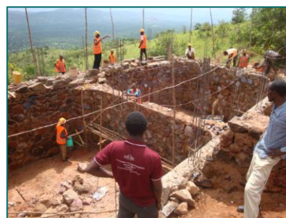
7. Vandtanken i fundamentet på soveafdelingen.