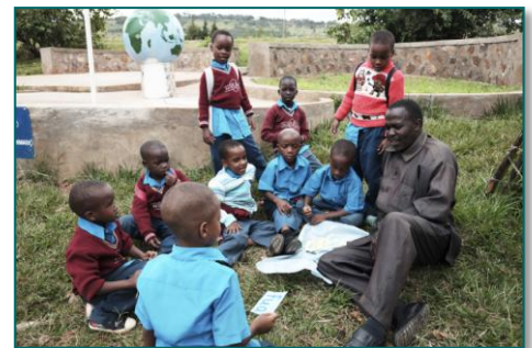
2. Undervisning i det fri